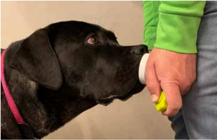
Die Hunde trainieren zwei Jahre lang, bevor sie in den Einsatz geschickt werden. Auch danach trainieren sie an der Hundeschule weiter