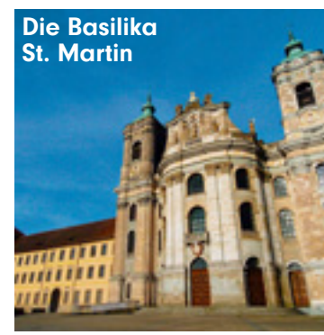
Die Basilika St. Martin