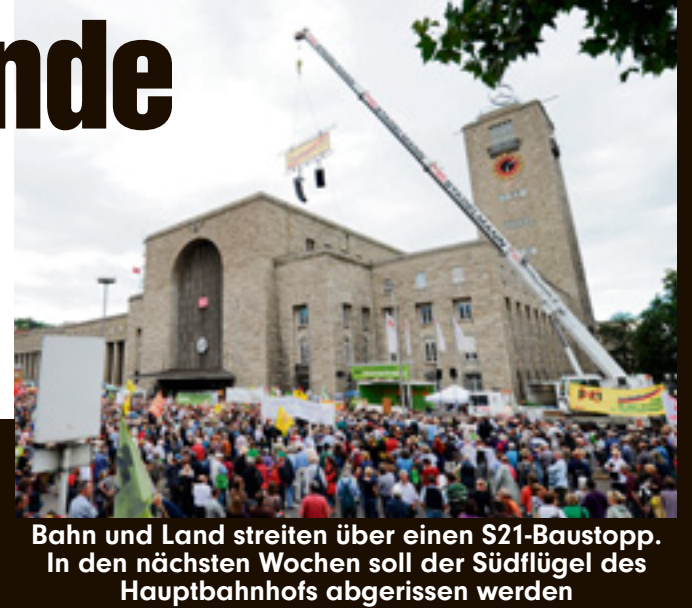
Bahn und Land streiten über einen S21-Baustopp. In den nächsten Wochen soll der Südflügel des Hauptbahnhofs abgerissen werden

„Stuttgarter Zeitung“. Die SPD würde ihren Stimmenanteil bei 23 Prozent etwa halten können. Die CDU käme nur noch auf 36 Prozent (39), und die FDP würde mit 4 Prozent (5,3) den Einzug in den Landtag verpassen.