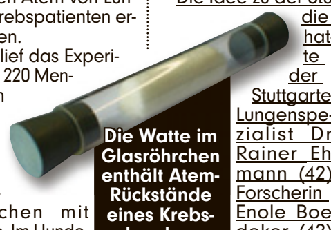
Die Watte im Glasröhrchen enthält Atemrückstände eines Krebskranken

Haben Tiere übernatürliche Kräfte, einen 6. Sinn? Zoologe Günther Schlessner (53) von der Wilhelma: „Manchmal möchte man es meinen. Wenn wir mit Eseln den Transport in andere Zoos üben, laufen die Tiere immer brav über die Rampe in den Hänger. Wenn es wirklich auf die Reise gehen soll, schalten die Esel auf stur. Wahrscheinlich spüren sie, dass sich die Tierpfleger ein klein wenig anders verhalten. Sie riechen den Stress und wissen, dass ein ganz anderes Programm abläuft.“